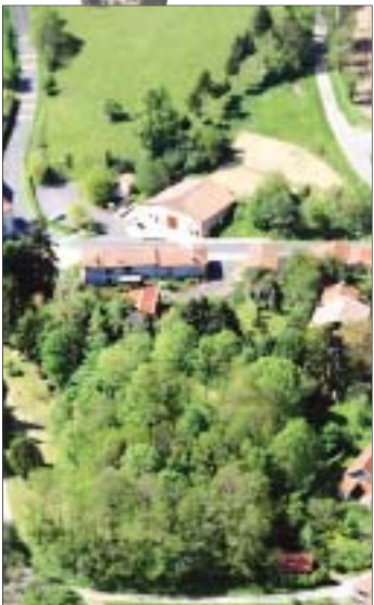
La motte castrale, à Mazerolles, servait vraisemblablement de point d'observation pour protéger un château aujourd'hui disparu.

Avec une grande minutie, il détaille deux points hauts (et chauds) qu'il va falloir franchir: La Fenêtre, dans le vignoble de Saint-Sornin, L'Arbre, à Mazerolles . Il révèle aussi les surprises et les sites à ne pas manquer au fil de la randonnée: le Moulin de la pierre à Vilhonneur, qui