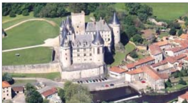
Le château de la Rochefoucauld sera le point de ravitaillement pour l'épreuve.