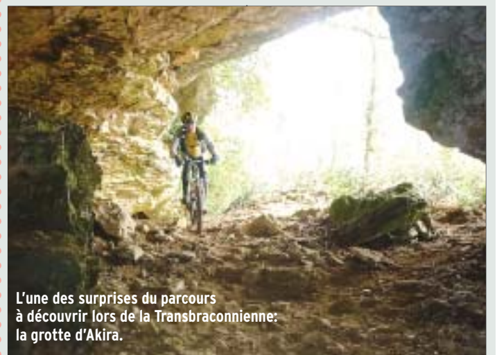
L'une des surprises du parcours à découvrir lors de la Transbraconnienne: la grotte d'Akira.

Rendez-vous demain, dimanche, dès 7h30 pour les premiers départs à la salle municipale de Mornac. Randonnées VTT: 15, 32 ou 50 km (3,5 € pour les licenciés, 5,5€ pour les autres). Gratuit pour les moins de 16 ans. Raid VTT 80 et 100 km. 18 € pour les licenciés, 20€ pour les autres. Réservé aux plus de 18 ans.