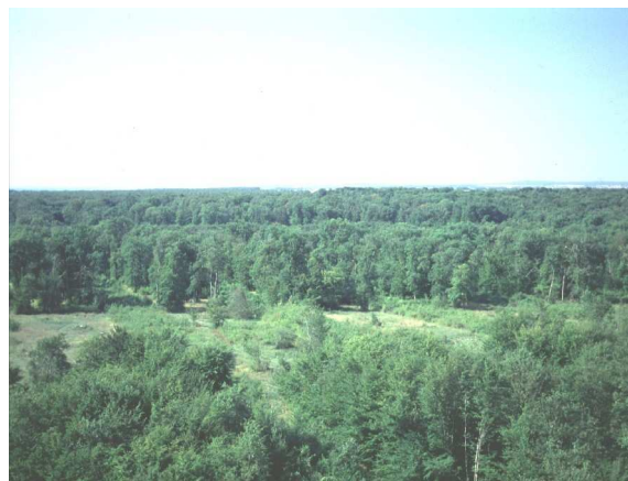
Terres boisées (la marche boisée et le pays du karst)