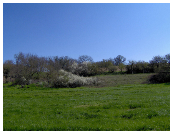
Plaines vallonnées et/ou boisées : le ruffécois et la plaine haute d'Angoumois