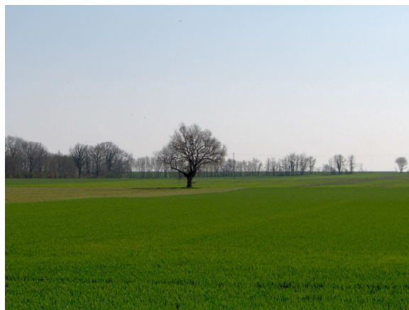
Plaines de champs ouverts (la plaine d'Aunis et la plaine du nord de la Saintonge)