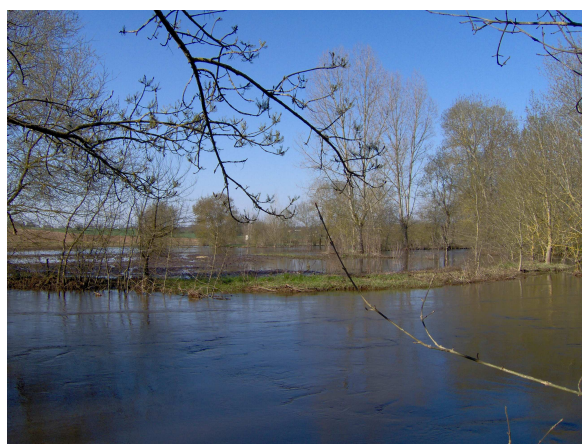
Vallées de la Boutonne et de la Charente